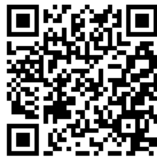
外文姓名中譯 音系統