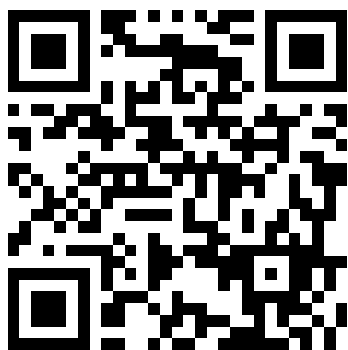
學生英文姓名 登錄系統